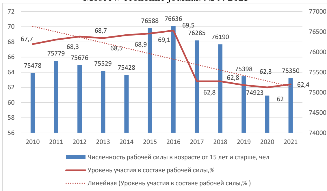
Рисунок 1. – Сравнительная динамика численности рабочей силы и уровня участия в составе рабочей силе населения