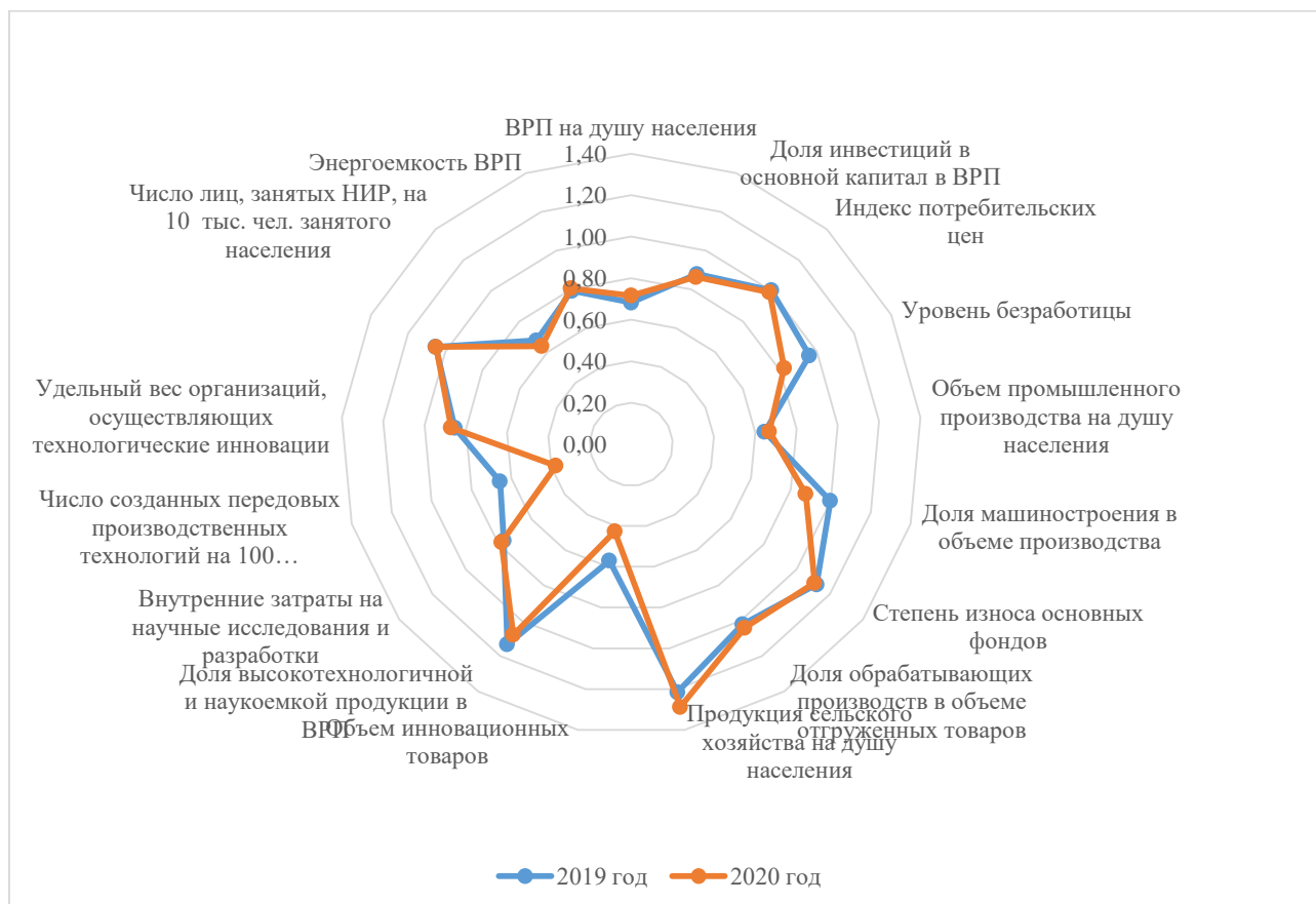
Рисунок 2. Индикаторы системы слежения за параметрами экономического потенциала Саратовской области

производства, являющиеся интегральными результатами и отражающие неблагоприятную динамику регионального экономического развития. Неблагоприятное значение доли исследователей в структуре занятых подтверждает существование проблем прогрессивного инновационного развития в регионе.