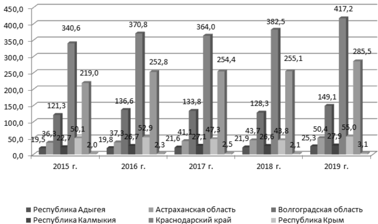
Рисунок 2 – Динамика производства сельскохозяйственной продукции в Южном федеральном округе за период 2015-2019 гг. в региональном разрезе, млрд. руб.