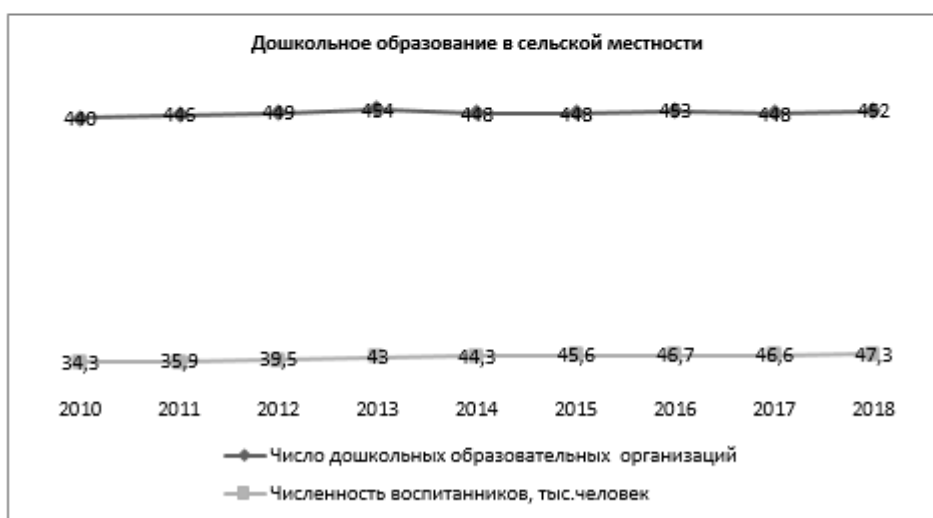
Рисунок 3 - Показатели дошкольного образования в сельской местности Ставропольского края [4]