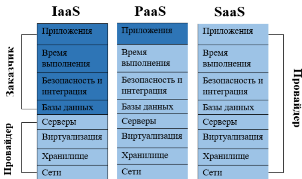
Рисунок 1 – Модели облачных сервисов

В области логистики и муниципального управления облачные вычислительные технологии играют ключевую роль в повышении эффективности управления предприятием. Например, при использовании облачных технологий на логистическом уровне, предприятие может получать доступ к облачным хранилищам данных и использовать их для хранения информации о товарах, поставках и заказах, а также для автоматической обработки заказов и отслеживания поставок [1].