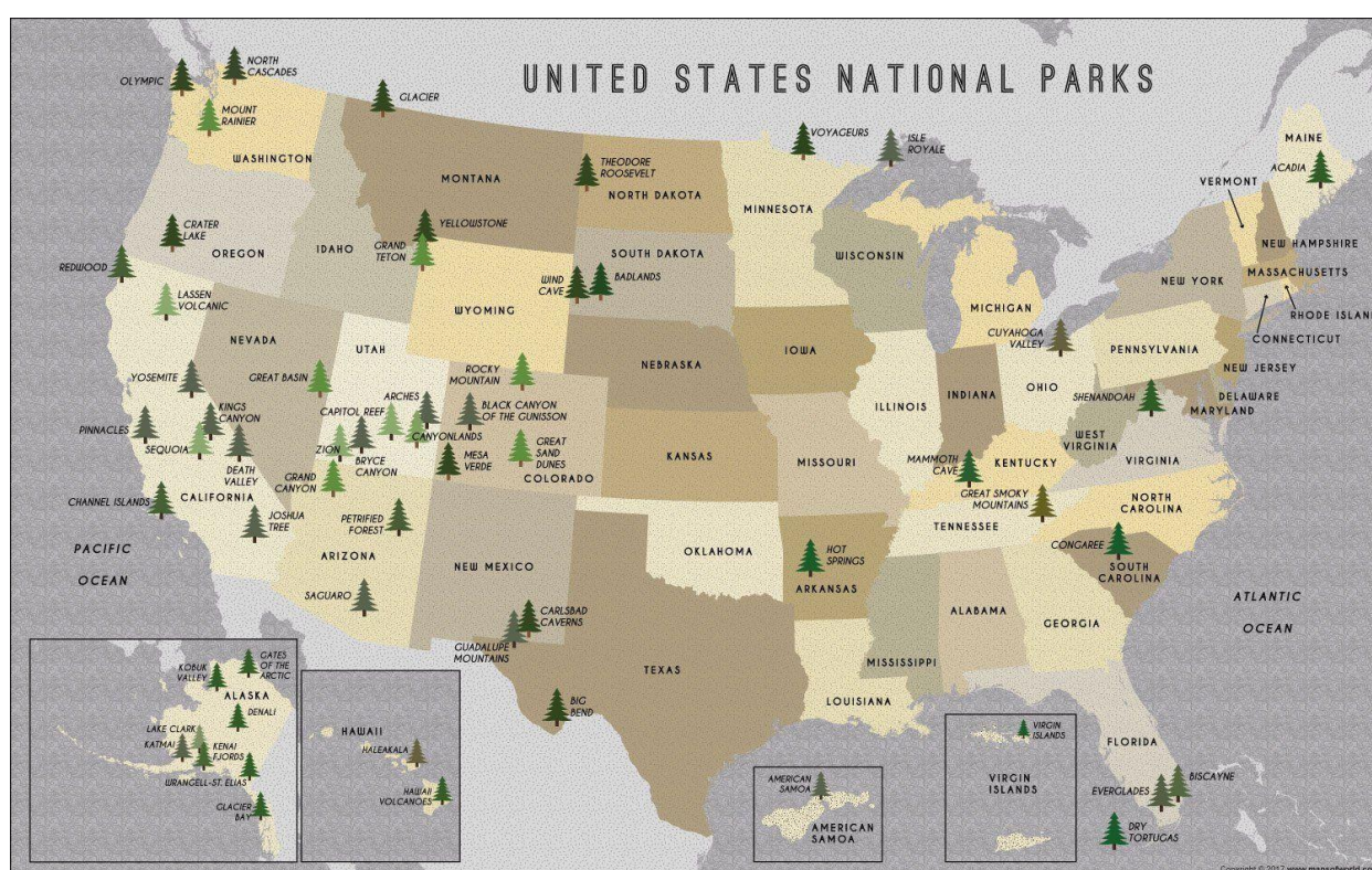
Рисунок 2. Схема расположения национальных парков США

Вышеуказанные документы служат нормативами и инструкциями для разных профессий (проектировщиков, менеджеров, туроператоров, рейнджеров, исследователей), а также для самих посетителей. Самое важное, что не остается не освященными один важный вопрос, касающийся проблемы развития туризма и сохранения природного и культурного наследия.