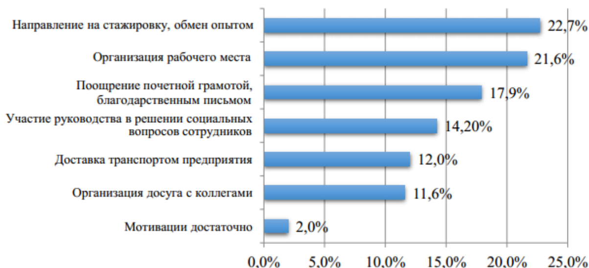
Рисунок 4 - Актуальные потребности сотрудников

Лишь 2% респондентов решили, что мотивации достаточно. По ответам, полученным на данный вопрос, очевидно, что сотрудники испытывают нужду в организации рабочего места, участии руководства в решении социальных вопросов, организации совместного досуга. Кроме того, немаловажен, тот факт, что сотрудников мотивировало бы к достижению высоких показателей в работе, если бы их труд был признан на уровне среднего или высшего руководства и отмечался почетной грамотой, благодарственным письмом с отражением в трудовой книжке.