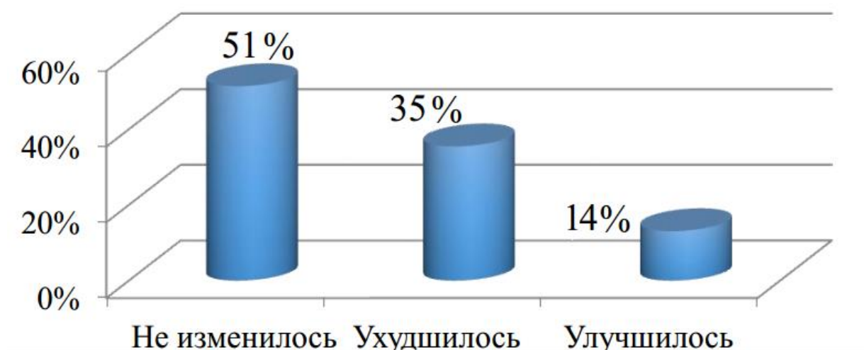
Рисунок 2 - Мнение сотрудников о направленности изменений социально-психологического климата

Так же респонденты имели возможность открыть свою точку зрения относительно необходимости признания заслуг работников [6] посредством материального неденежного поощрения. (рисунок 3)