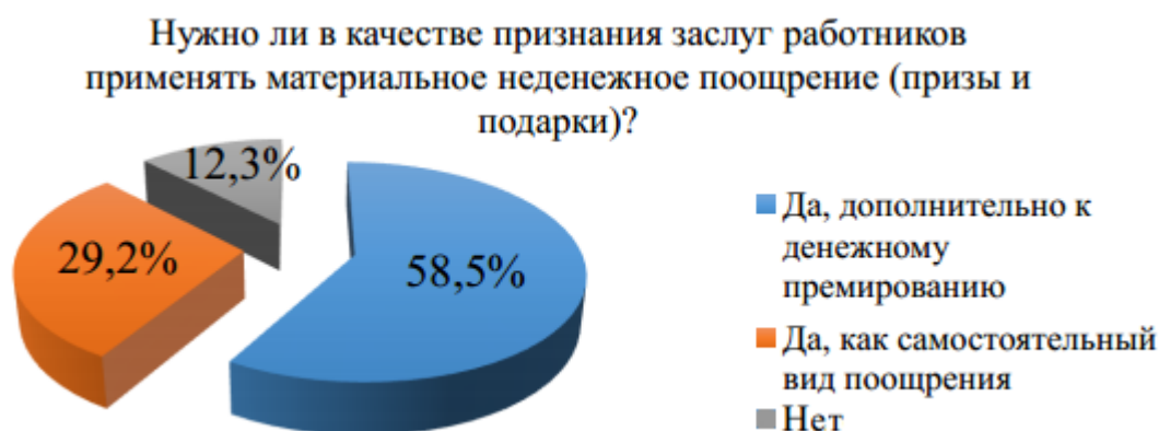
Рисунок 3 - Мнение сотрудников о применении материального неденежного поощрения

Так же респонденты имели возможность открыть свою точку зрения относительно необходимости признания заслуг работников [6] посредством материального неденежного поощрения. (рисунок 3)