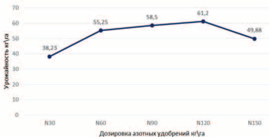
Рисунок 2. Изменение урожайности в зависимости от внесения дозы азотных удобрений Figure 2. Effect of nitrogen fertilizer dosage on crop yields

Выводы. В рамках выполненных исследований по решению задачи повышения производства риса в Республике Гана был проведен критический анализ существующих технологий выращивания риса, выявлены их эффективные и менее эффективные показатели. По результатам работы была предложена усовершенствованная технология возделывания риса и режимы орошения, которые обеспечат гарантированную урожайность, в том числе в засушливый период. В качестве аналога для разработки водосберегающих режимов орошения риса были использованы сельскохозяйственные технологии и система орошения риса в Краснодарском крае (Россия).