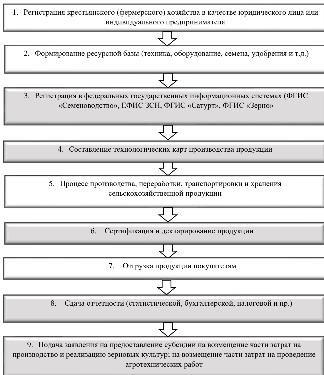
Рисунок 2. Алгоритм функционирования современного растениеводческого крестьянского (фермерского) хозяйства

В рамках исследования развития растениеводческих КФХ в условиях цифровизации АПК важно рассмотреть основные этапы их создания и функционирования (рисунок 2).