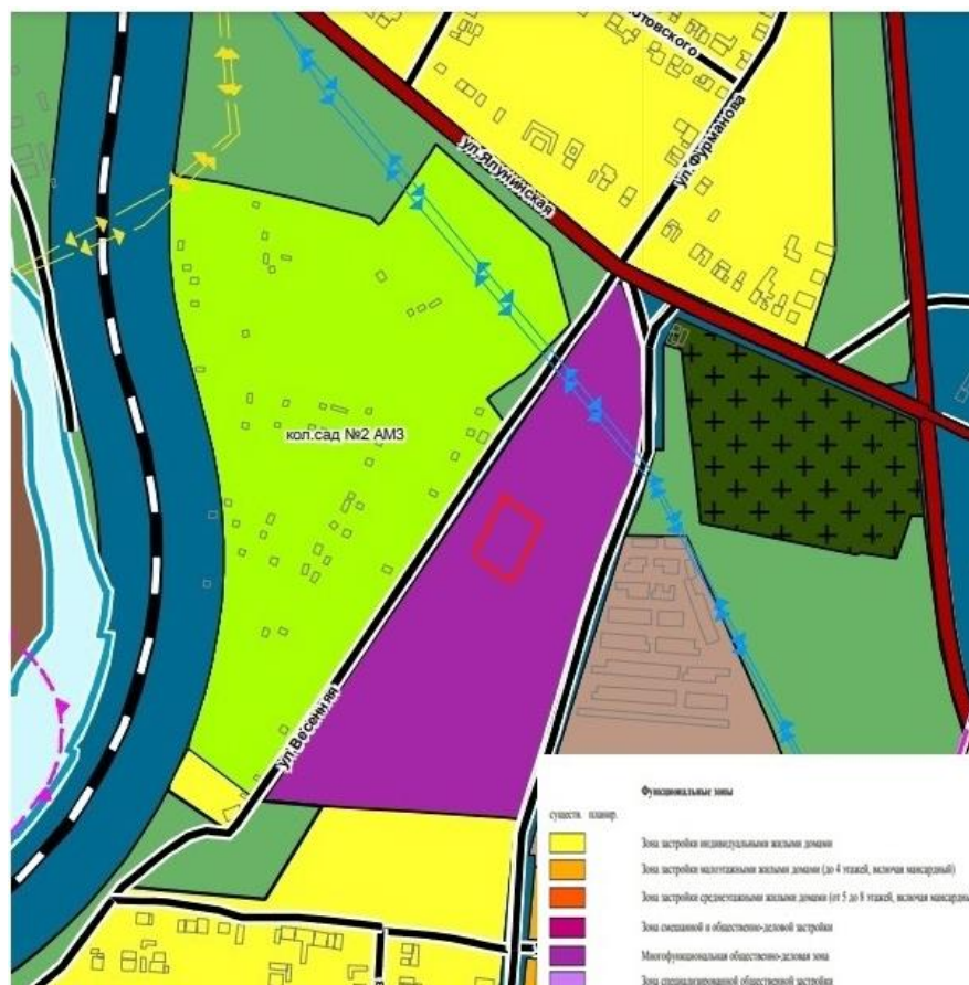
Рисунок 2. Схема расположения земельного участка на генеральном плане

Земельный участок имеет спокойный рельеф, благоприятствующий строительству [5,6]. Данный участок не занят каким-либо объектом