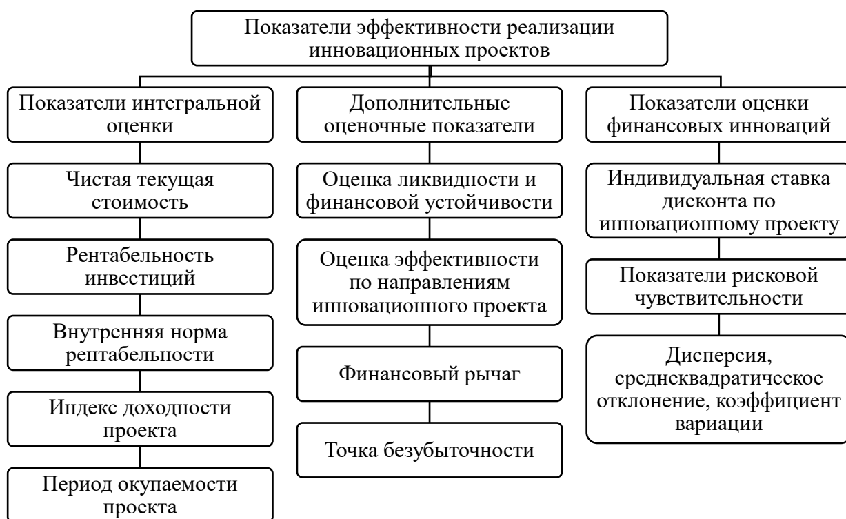
Рисунок 1. Совокупность показателей оценки эффективности реализации инновационных проектов [4]

аналитического инструментария, позволяющего дать целостную оценку уровню эффективности реализации инновационных проектов. Однако, наиболее интересный подход (хотя он и комплексный, не учитывающий специфику деятельности финансовых организаций) к оценке инновационных проектов, представлен в работе Т.Ю. Поповой, которая обосновывает значительное число показателей, позволяющих дать целостную оценку уровня эффективности реализации инновационно-инвестиционных проектов. Для большей наглядности, совокупность показателей, которая может быть использована для проведения анализа и оценки уровня эффективности реализации инновационных проектов проиллюстрирована в форме рисунка 1.