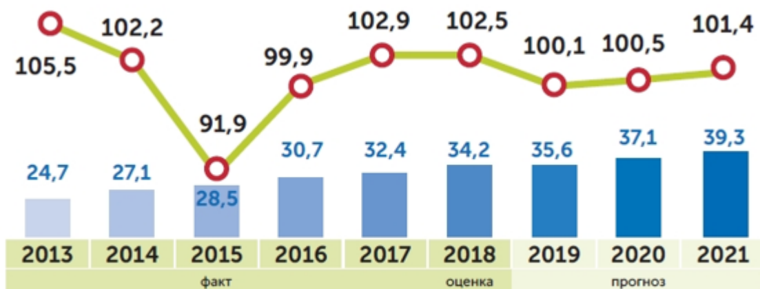
Рисунок 2. Динамика изменения номинальной и реальной заработной платы в Пермском крае.

аналогичным периодом 2017 года (с 14,9 млн до 7,5 млн рублей). В прогнозируемом периоде сохранится положительная динамика роста фонда оплаты труда – ежегодно на 5–6%.