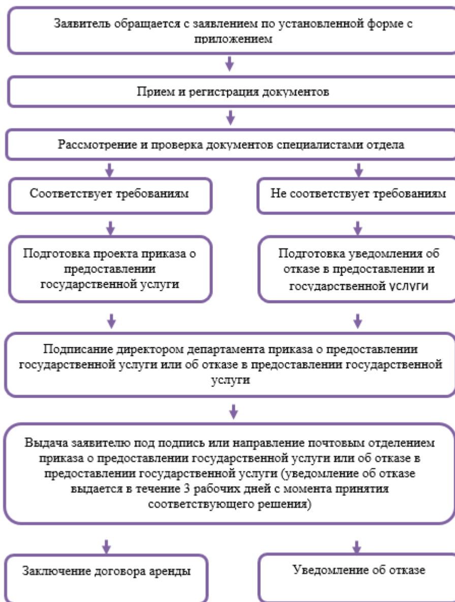
Рисунок 2. Последовательность предоставления государственной услуги

Специалист Департамента регистрирует входящие документы в соответствии с установленными в департаменте правилами делопроизводства, делая на экземпляре заявления отметку о дате поступления документов с одновременным присвоением входящего номера.