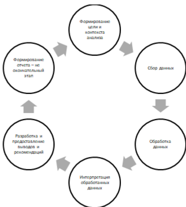
Рисунок 2 - Этапы проведение финансового анализа