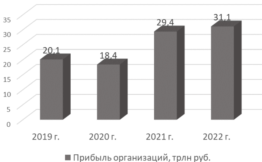
Рисунок 1 – Динамика прибыли организаций РФ за период 2019-2022 гг

Вместе с тем, динамично меняющиеся условия внешней среды, рыночной конъюнктуры, государственное регулирования требуют дополнительной научной интерпретации корпоративного финансового менеджмента применительно к современным российским условиям. Подобная аналитика подразумевает исследование показателей прибыли хозяйствующих субъектов РФ, т. к. именно получение прибыли является целью любой экономической деятельности. Динамика прибыли организаций РФ за период 2019-2022 гг отражена на рисунке 1 [4].