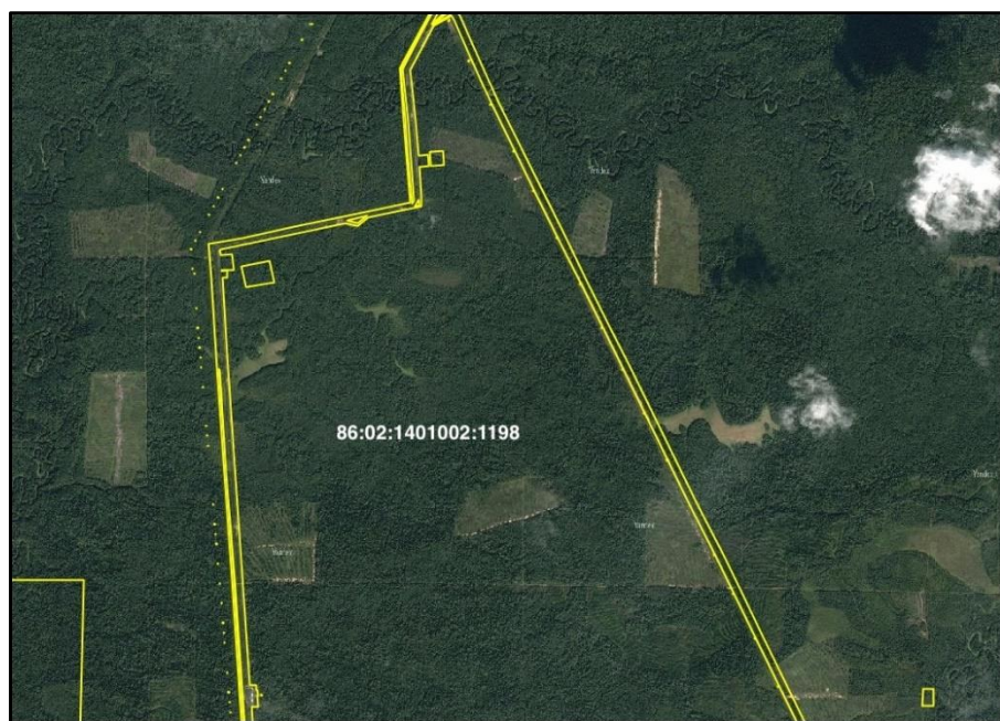
Рисунок 3. Места сплошной рубки на лесном участке 86:02:1401002:1198

На рисунке 3 показаны места сплошных рубок в границах части лесного участка с кадастровым номером 86:02:1401002:1198, предоставленного в аренду для целей заготовки древесины [11].