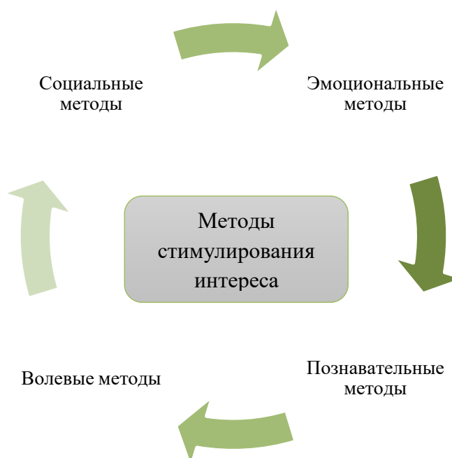
Рисунок 3 – Методы стимулирования интереса

Рассматривая методы стимулирования стоит отметить четыре ключевых аспекта (рис. 3).