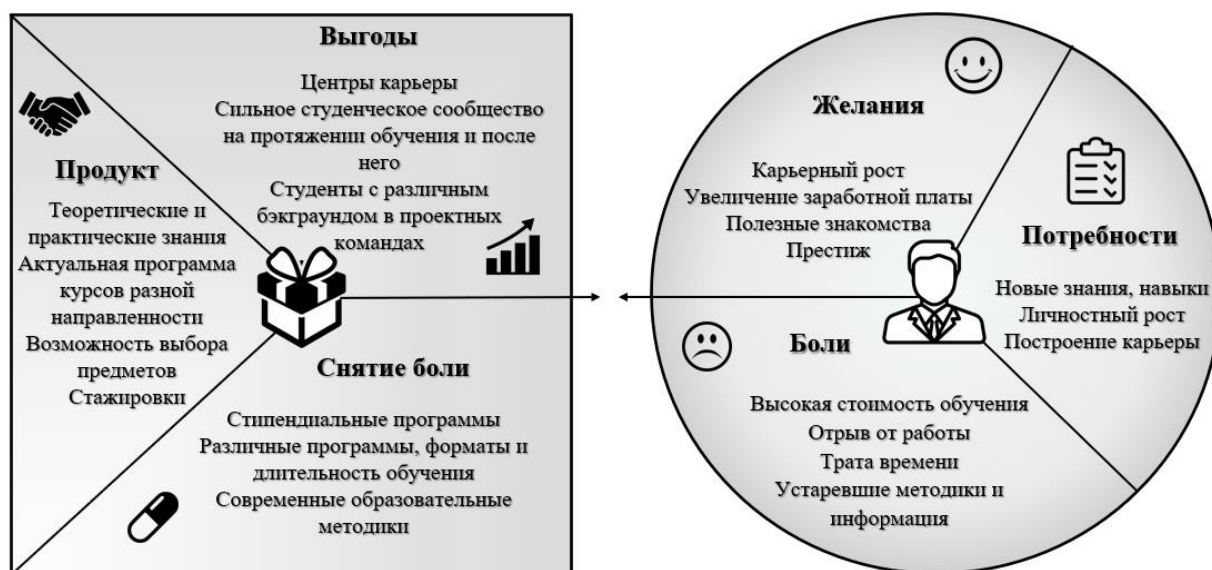
Рисунок 1. Ценностное предложение