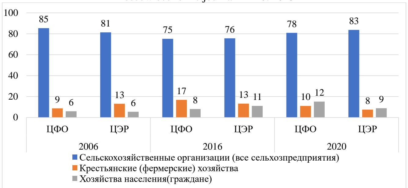
Рисунок 1. Изменение доли сельскохозяйственных угодий по формам хозяйствования в Центральном федеральном округе и Центральном экономическом районе, %

Установлено, что в целом по Центральному федеральному округу на 7% уменьшилась доля сельскохозяйственных угодий в сельскохозяйственных организациях при увеличении доли сельскохозяйственных угодий в крестьянских (фермерских) хозяйствах на 1% и в хозяйствах населения на 6%. При этом в Центральном экономическом районе растет доля сельскохозяйственных угодий в сельскохозяйственных организациях и хозяйствах населения при уменьшении в крестьянских (фермерских) хозяйствах [7].