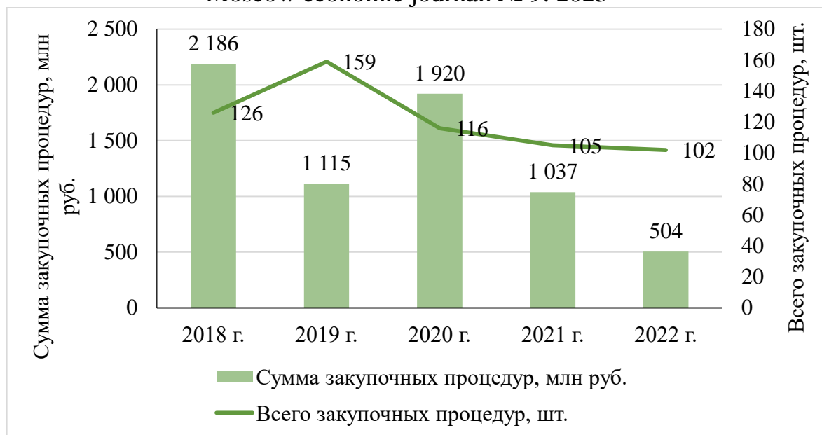
Рисунок 2. Динамика закупочной деятельности Центральной базовой таможни [7]

Структура закупочных процедур представлена на рисунке 3.