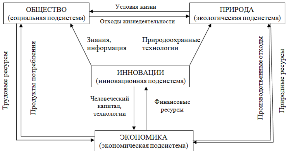
Рисунок 1 – Схема взаимодействия компонент (подсистем) устойчивого развития [10]

региона, обеспечивающий ее прогрессивное развитие» [9]. В данном определении внимание обращено на то, что в основе обеспечения устойчивого развития региона находится баланс системообразующих компонент (подсистем), которыми являются: общество, природа, экономика и инновации. На рисунке 1 представлена схема, отражающая взаимодействия этих компонент в региональной экономике.