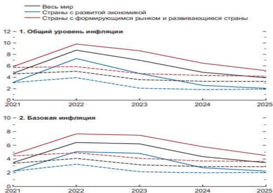
Рисунок 2 – Глобальный общий уровень инфляции [13]

Умеренное ужесточение финансовых условий ведет к снижению уровня мирового объема производства на 0,3% в 2023 году, что подразумевает реальный рост примерно на 2,5% вместо 2,8% в базовом прогнозе [12].