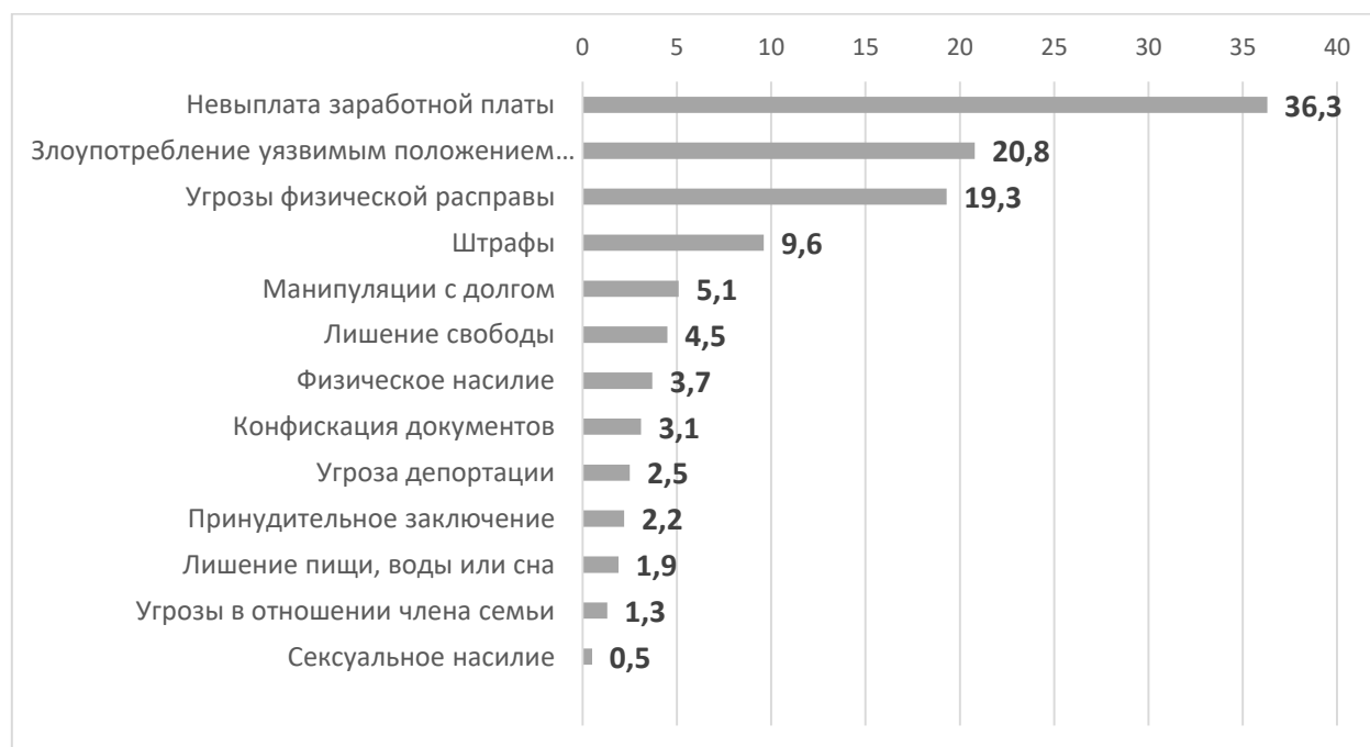
Рисунок 1 Формы принуждения к принудительному труду (доля рабов, %)