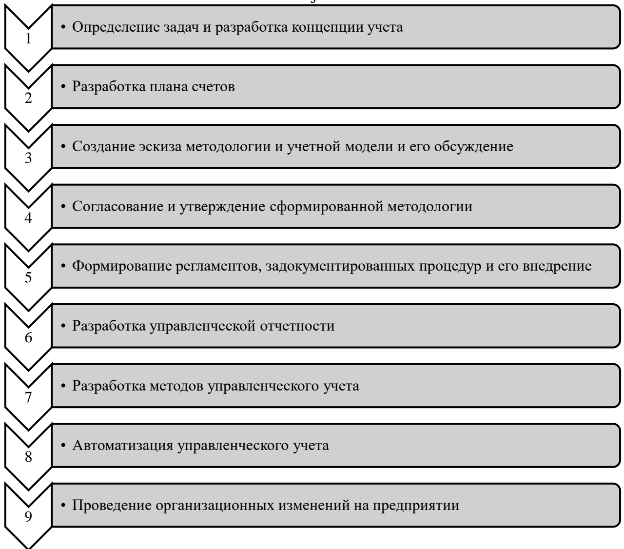
Рисунок 2. Алгоритм постановки и ведения управленческого учета предприятия

Таким образом, управленческий учет является системой, которая обеспечивает менеджмент организации ценной информацией, используемой в принятии управленческих решений. Выше предлагаемый алгоритм постановки и ведения управленческого учета предприятия позволяет получить информацию, которая необходима для расстановки приоритетов в деятельности организации и планирования дальнейшей деятельности.