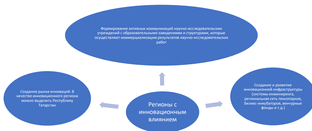
Рисунок 5. Признаки региона с инновационным влиянием

Выделенные выше преимущества являются источником роста ВРП и позволяют занять достойное место по его значению среди субъектов РФ. Превалирование тех или иных отраслей определяет во многом ориентацию на развитие взаимодействия с родственными и поддерживающими отраслями экономики других регионов. Инфраструктурное влияние основывается на благоприятном геополитическом расположении и инфраструктуре, которая связывает регионы. Через инфраструктуру происходят коммуникации, обмен ресурсами. Инновационное влияние. Ученые выделяют следующие признаки, которые служат основными для выделения региона с инновационным влиянием: