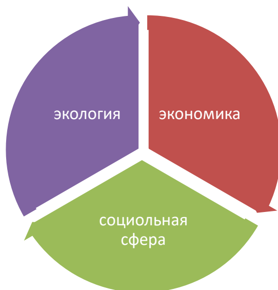
Рисунок 1. Концепция устойчивого развития

На сегодняшний день в мировой практике принята концепция устойчивого развития – это триединство экологической, экономической и социальной составляющих.