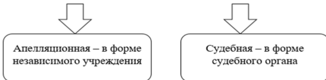
Рисунок 3 – Система контроля в сфере государственных закупок Германии

Все предприятия в Германии, в том числе и частные структуры, которые приравниваются к государственным заказчикам, находятся под действие системы контроля, включающей в себя следующие инстанции (рисунок 3):