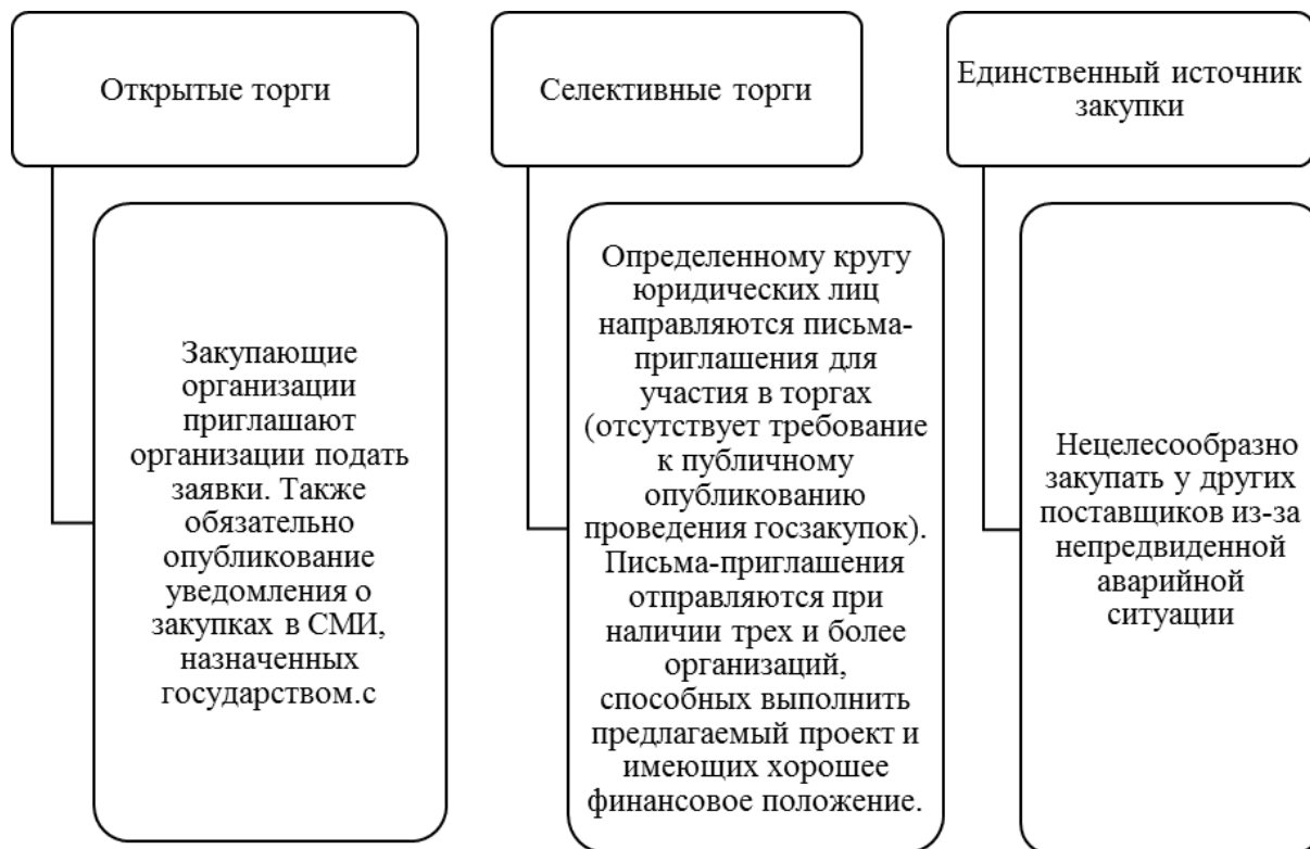
Рисунок 4 – Способы осуществления закупок в Китае

В Китае выделяется три способа осуществления закупок (Рисунок 4).