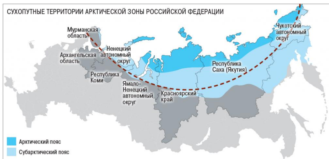
Рис. 2 Сухопутные территории Арктической зоны Российской Федерации

В 2016 г. Президент РФ в рамках Совещания по вопросам социально-экономического развития Дальневосточного федерального округа, подчеркнул, что развитие данного региона, является одним из приоритетных направлений государственной политики, при этом В.В. Путин указал, что необходимо создавать такие условия, которые способствовали бы вовлеченности и активному участию граждан в формировании и реализации данных социально-экономических направлений [9].