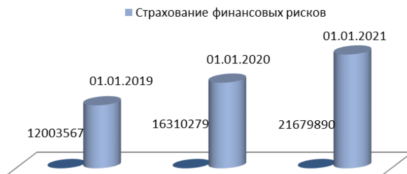
Рисунок 3 – Динамика страхования финансовых рисков развития коммуникационного менеджмента 2019-2021 гг., кол-во договоров, шт.

Особенностью организации коммуникационного менеджмента выступает использование общественного самоуправления и контроля с вовлечением сотрудников в производственный процесс, а производственно – хозяйственные функции и организационная структура обуславливают потребность в профессиональном управлении с участием высококвалифицированных менеджеров. Стоит отметить, что единство и взаимосвязь общественного и профессионального управления данным видом организации создают определенную подсистему кооперативного самоуправления, которая характеризует специфику развития коммуникационного менеджмента в управлении экономическими системами региональной сферы в условиях вызовов современной экономике. Организации, использующие коммуникационный менеджмент имеют огромное значение и оказывают влияние не только на экономику государства, но и на социально – экономические задачи и статус общности, соответственно, что позволяет в укреплении коллективного сотрудничества внутри самой организации. Итоги данного сотрудничества зависят от специфики и качества кооперативного менеджмента, а также профессионализма сотрудников доступным для представителей сферы услуг региональной сферы.