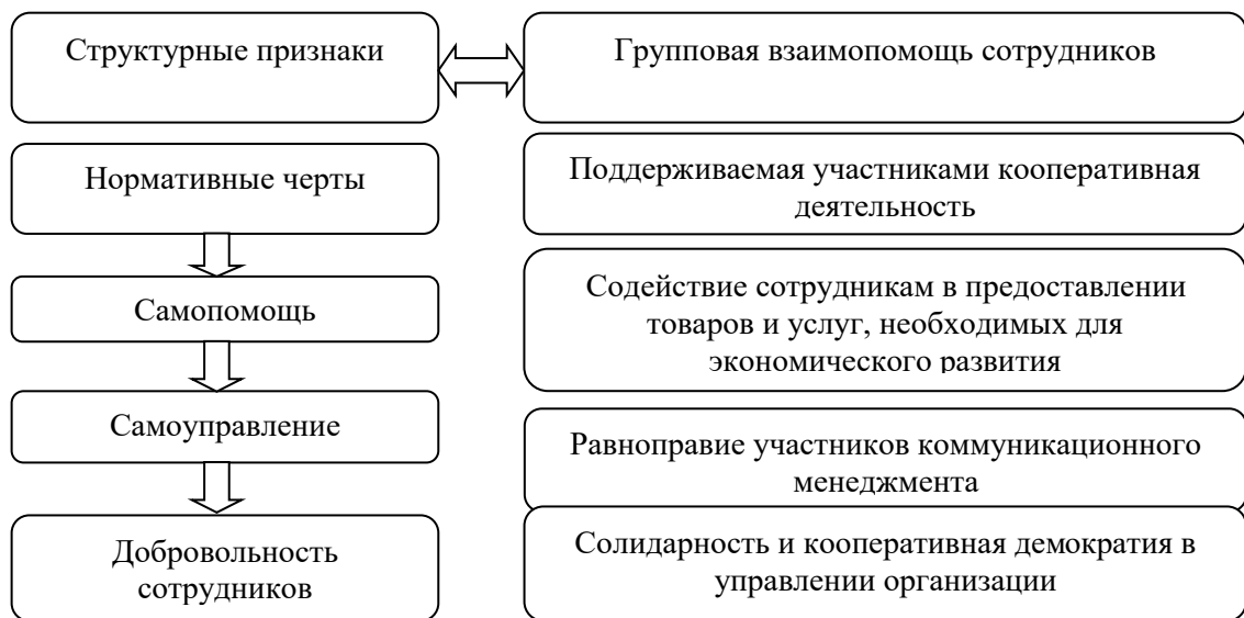
Рисунок 2 - Характерные черты структуры организации региональной сферы

Далее, рассмотрим характерные черты структуры организации региональной сферы, представленные на рисунке 2.