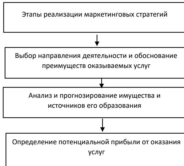
Рисунок 5 – Этапы реализации маркетинговых стратегий

В качестве теоретической и информационной базы по исследуемой теме выступали: учебные пособия, нормативно–правовые документы Правительства, Минфина по вопросам регулирования учёта, научные труды отечественных ученых и специалистов в области учёта и психологии по исследуемой тематике. В том числе многие научные статьи других авторов, которые были посвящены данной теме. Стоит отметить, что труды ученых способствовали более глубокому и детальному изучению логической концепции развития коммуникационного менеджмента в управлении экономическими системами региональной сферы.