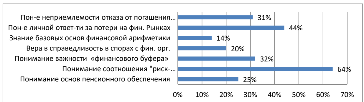
Рисунок 2 - Всероссийский опрос населения [2]

Данная проблема подтверждается результатами Всероссийского опроса населения, проведенного в 2015 г. Результаты опроса представлены ниже, где проценты отражают количество правильных ответов и понимания проблемы.