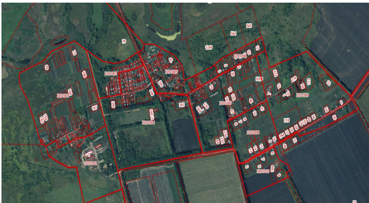
Рисунок 1 – Фрагмент публичной кадастровой карты с изображением кадастровых кварталов на анализируемой территории

Известно, что комплексные кадастровые работы проводятся в рамках кадастровых кварталов [1, 2]. Рассмотрим эффективность осуществления данного вида кадастровой деятельности на примере территории, расположенной в границах поселка Тимирязево Новоусманского муниципального района Воронежской области. В состав данной административно-территориальной единицы входит 10 кадастровых кварталов, в границах которых было проведено исследование эффективности проведения комплексных кадастровых работ. Поселок занимает площадь 268,87 гектаров. В результате осуществленного анализа, было выявлено, что на исследуемой территории в 10 кадастровых кварталах расположено 644 земельных участка. Анализируемая территория изображена на рисунке 1.