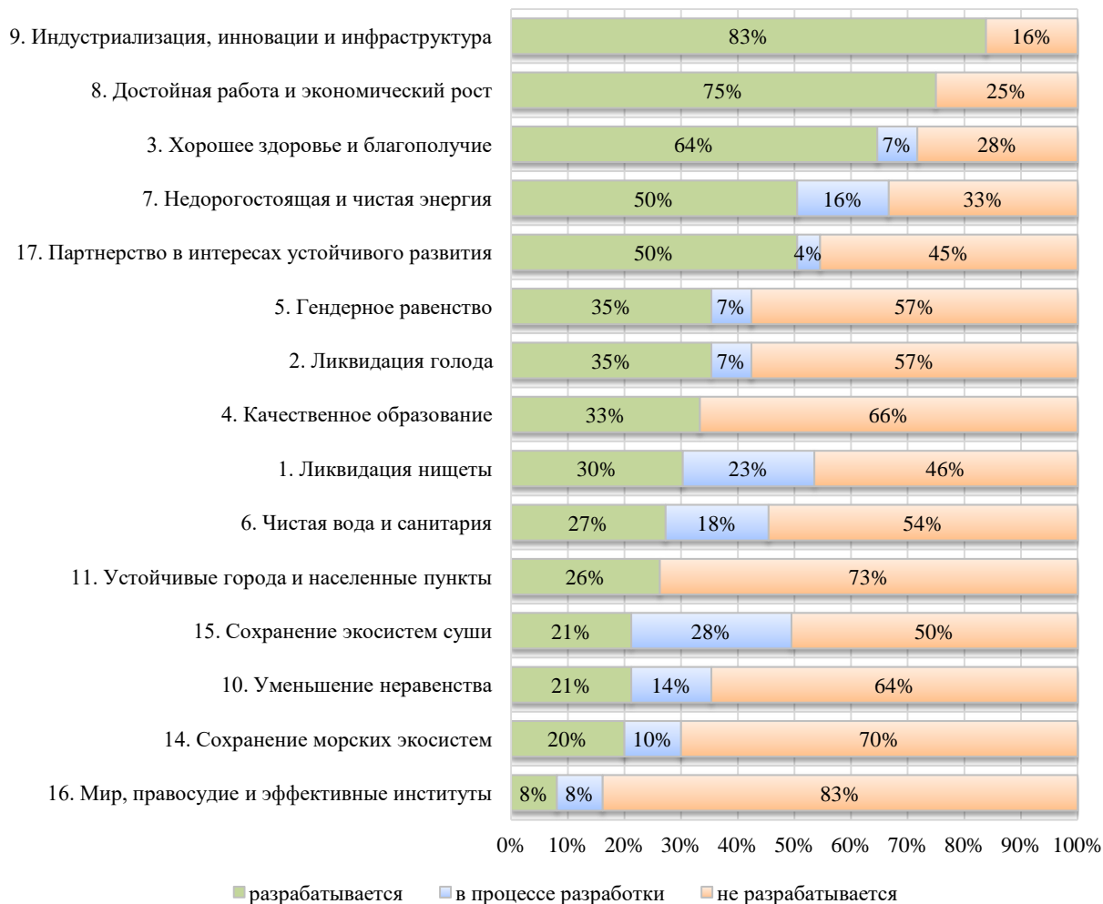
Рисунок 1. Статус разработки показателей ЦУР в России (составлено авторами на основе данных [13])

интересах устойчивого развития» - 50%. Степень разработки остальных десяти ЦУР оценивается на 35% и ниже, что свидетельствует о наличии определенных барьеров в их достижении на различных уровнях управления.