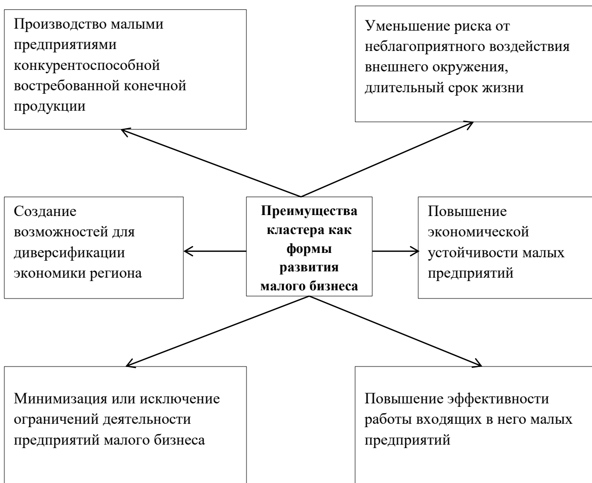
Рисунок 1. Роль кластера как формы организации и развития малого бизнеса в регионе (авторская разработка)

комплексный характер, тесно взаимосвязаны по времени, используемым ресурсам и по некоторым другим важным параметрам. В связи с этим управленческие структуры неизбежно сталкиваются с проблемами согласованного решения долгосрочных, среднесрочных и текущих задач.