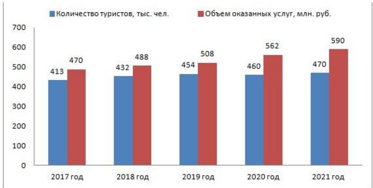
Рисунок 4. Туристский поток в Республику Адыгея в 2017-2021 гг.

не соответствующую значительному потенциалу развития туристической деятельности. В частности, удельный вес занятых в этой отрасли составляет менее 2,0 % от общей численности работающего населения.